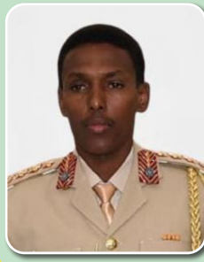
Brig. Gen. Odowa Yusuf Rage, CDS, Somalia