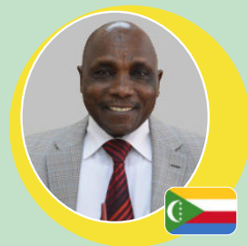
Amb. Chanfi Issimail Comores 2014 – 2017