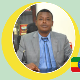
Brigadier General Getachew Shiferaw Fayisa Ethiopia 2020-