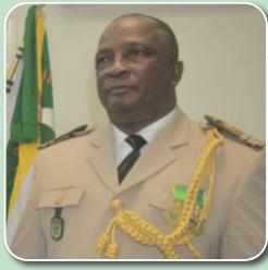
Col. Idjihadi Yousouf, CDS, Comoros